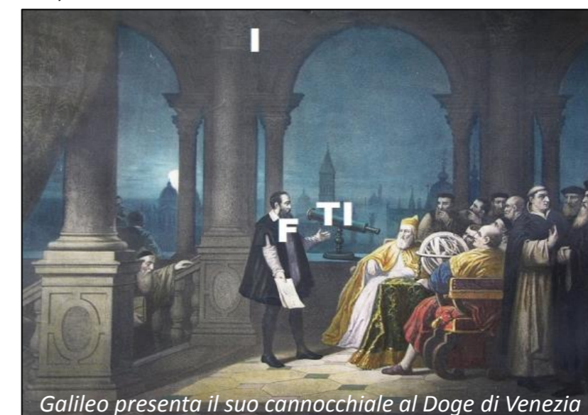
Galileo presenta il suo cannocchiale al Doge di Venezia