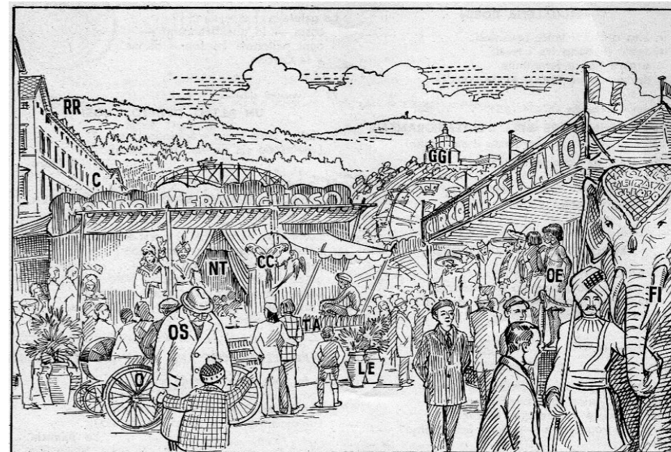
disegno di Aldo Cimberle

CARNEVALE IN PIAZZA VITTORIO VENETO A TORINO